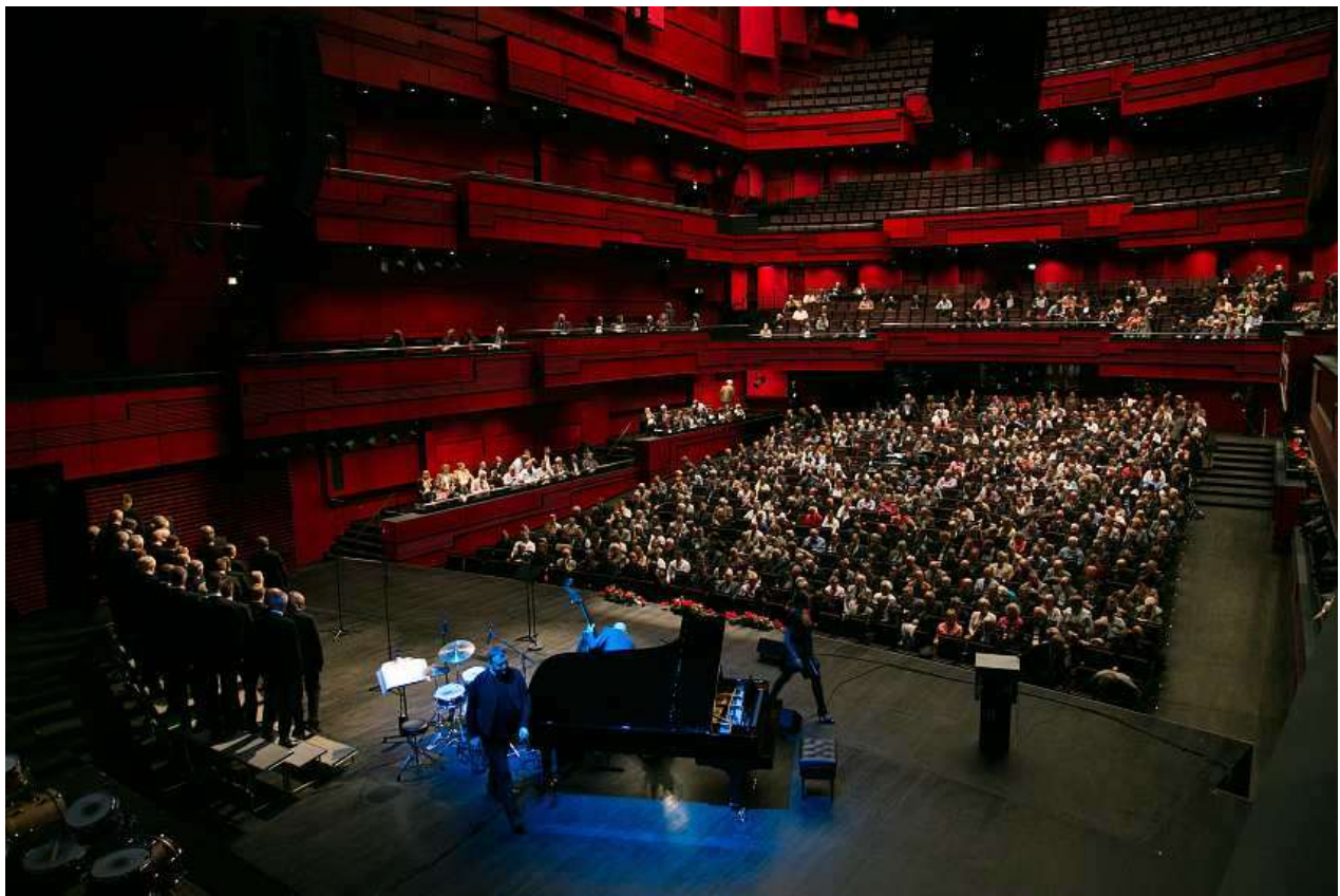
Åbningsceremonien i Eldborg

Denne rapport indeholder praktiske oplysninger om forberedelsen af kongressen og general fakta.