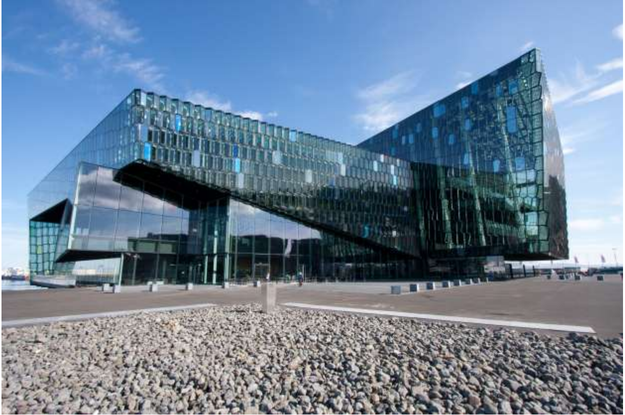
Harpa, concert and conference centre