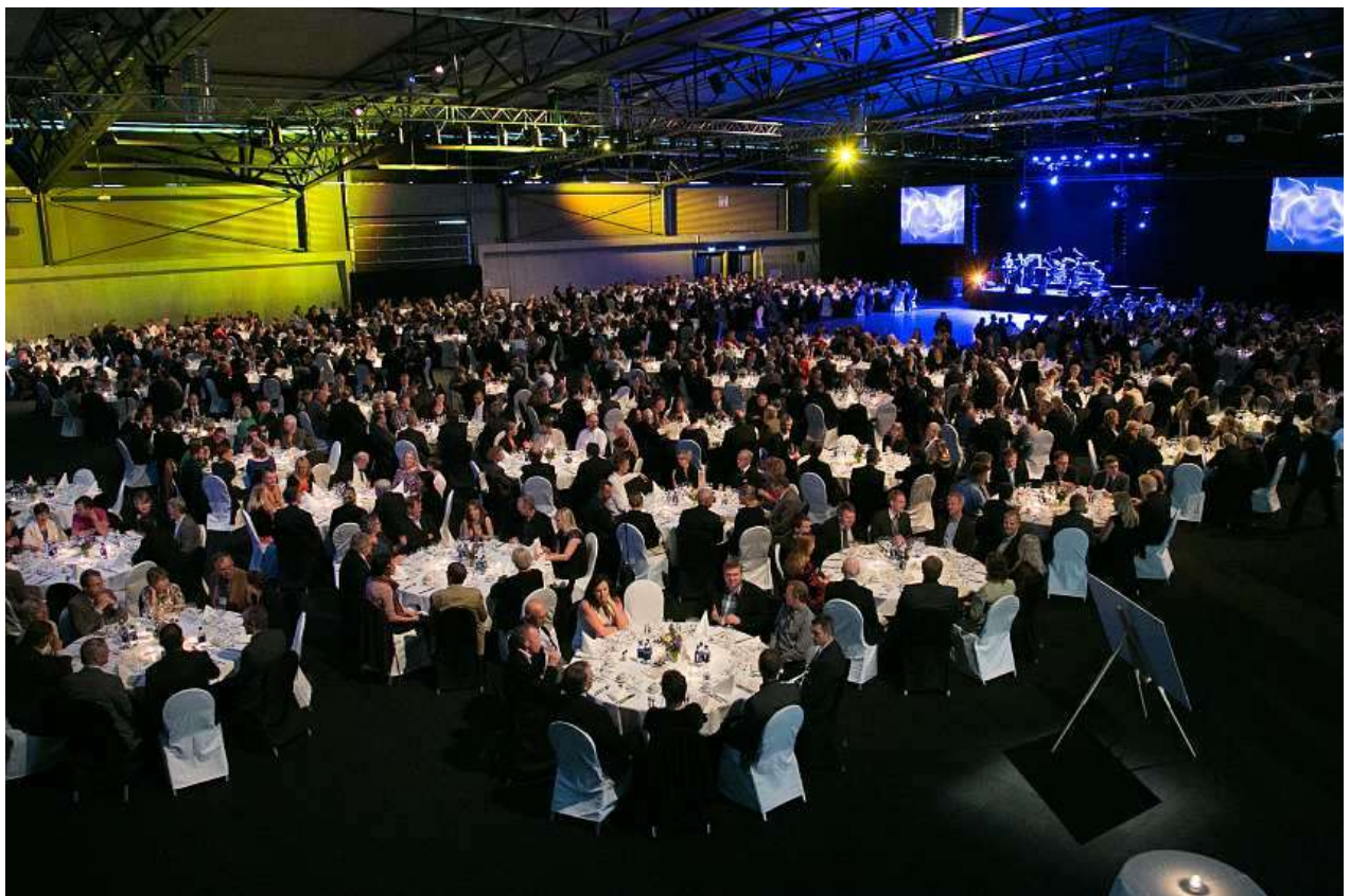
Festmiddag d. 12. juni i Laugardalshöll

Sponsorer: Rambøll, Colas og Vectura stillede op som sponsorer til kongressen.